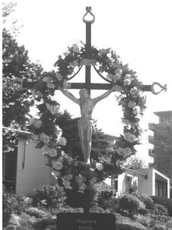
Wegkruis Dorpstraat / Raadhuisstraat met krans.