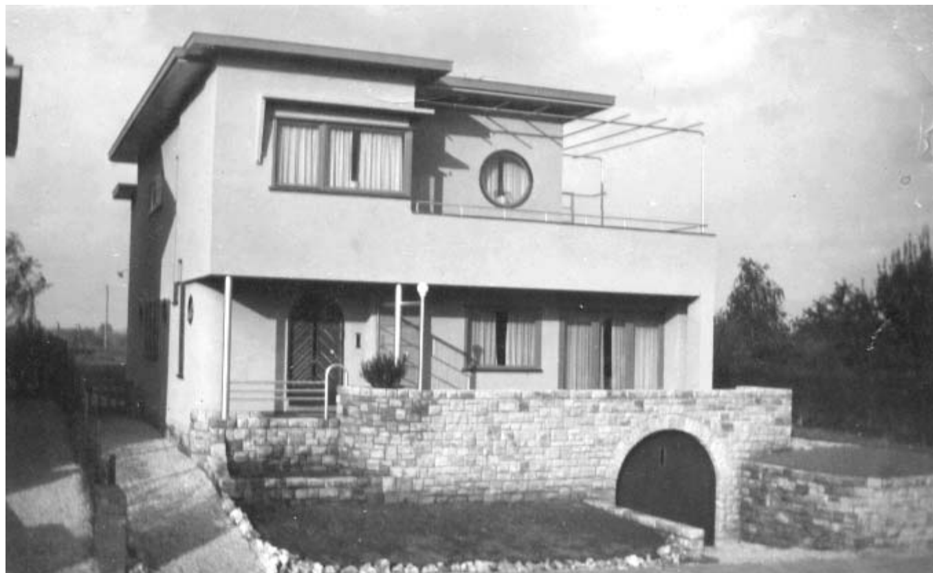
Foto: Woonhuis Lindestraat 136, ontworpen door Louis Willems.

Zoals in het verhaal vermeldt is opsomming van de panden ontworpen door Willems is niet volledig. Mocht U nog informatie hebben over panden ontworpen door Willems neem dan contact op met Marcel Senden www.marcelsenden@cs.com of 045-5252784.