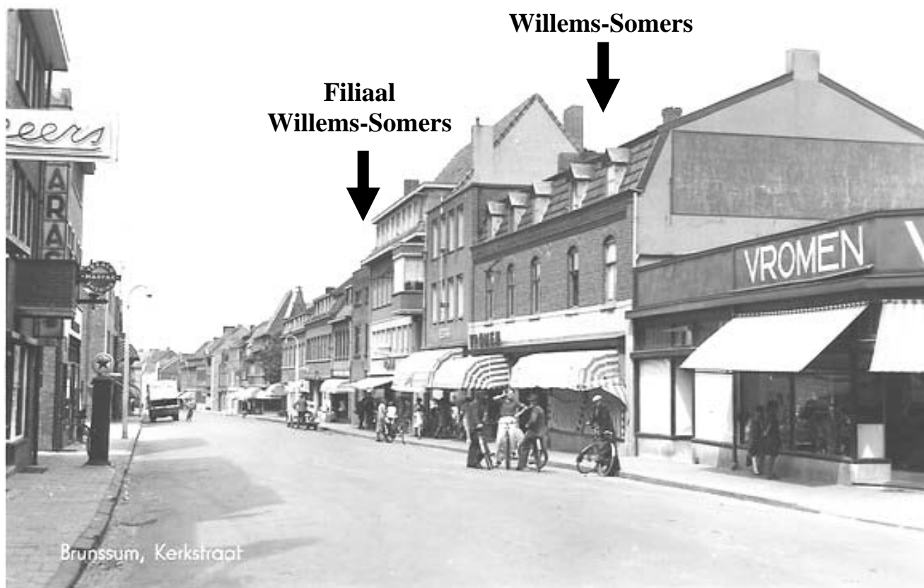
Foto: Kerkstraat in Brunssum. Het tweede pand van rechts is het zakenpand – woonhuis – architectenkantoor van de familie Willems-Somers. Het zesde pand van rechts (nu Wibra) werd het filiaal van de textielhandel Willems-Somers.