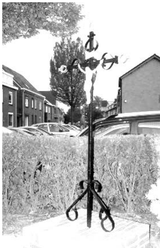
Wegkruis Kerkeveldstraat / Julianastraat.