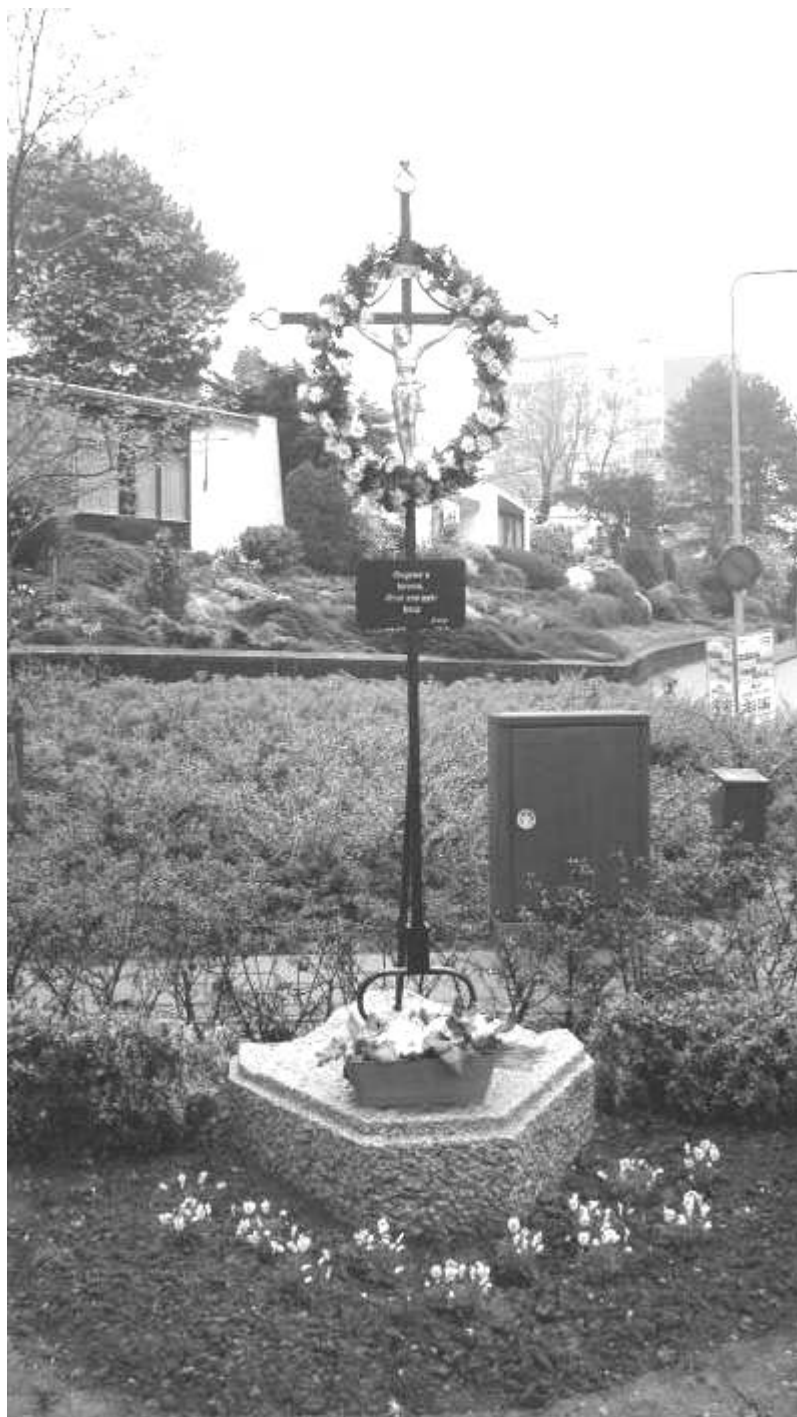
Wegkruis Dorpstraat / Raadhuisstraat

De eerste 3 wegkruisen van de gemeente Brunssum, Dorpstraat / Raadhuisstraat, Merkelbeekerstraat / Haefland en Kerkeveldstraat / Julianastraat zijn opgeknapt. Dit houdt in dat de kruisen gestraald en geverfd zijn. Verder zijn de ornamenten en de uiteinden van het kruis geschilderd in de andere kleur. Is het corpus goudbrons geschilderd dan zijn de uiteinden van het kruis zilverbrons van kleur en als het corpus zilverbrons is, dan zijn de uiteinden van het kruis goudbrons geverfd.