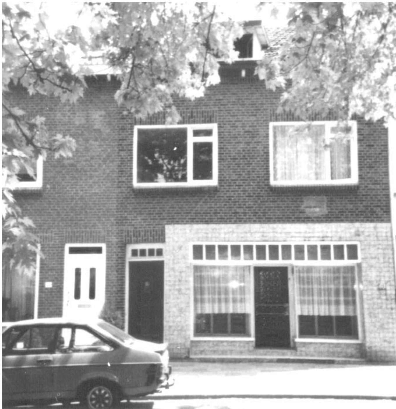
Foto: Winkelhuis (met bakkerij) van familie Smeets. De foto is dertig jaar geleden gemaakt op de locatie Pastoor Hagenstraat 20. Het pand is inmiddels verbouwd tot woonhuis.

Door: Thei Janssen † (met dank aan Joep Pisters).