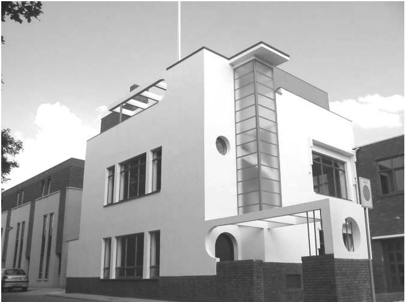
Foto: Kloosterstraat 17, Brunssum. Advocatenkantoor van Daemen Advocaten. Voorheen het Consultatiebureau van R.K. vereniging “Het Groene Kruis”.

De vlaggenmast is bij deze bouwstijl een onmisbaar attribuut.