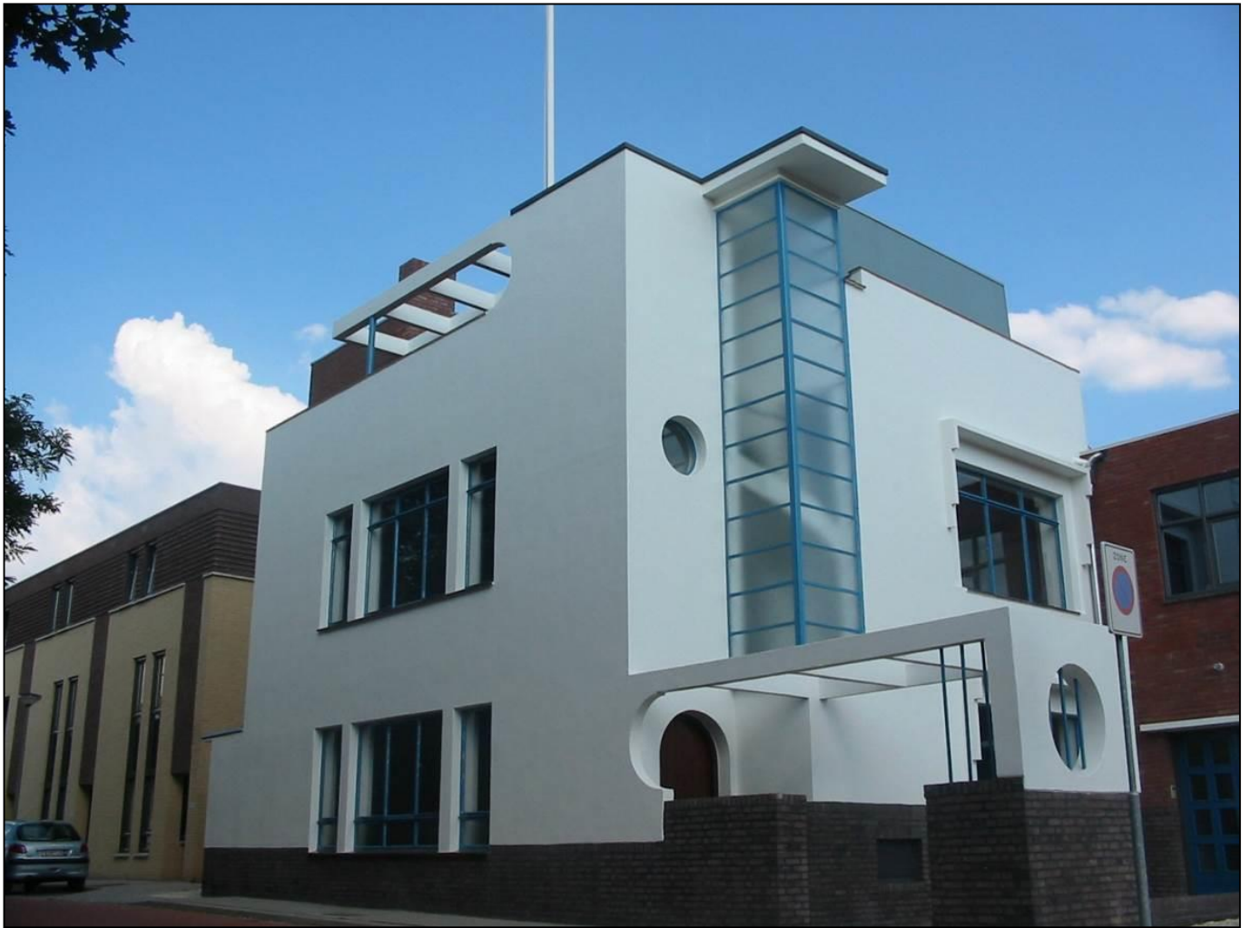
Foto: Groene Kruisgebouw aan de Kloosterstraat te Brunssum.