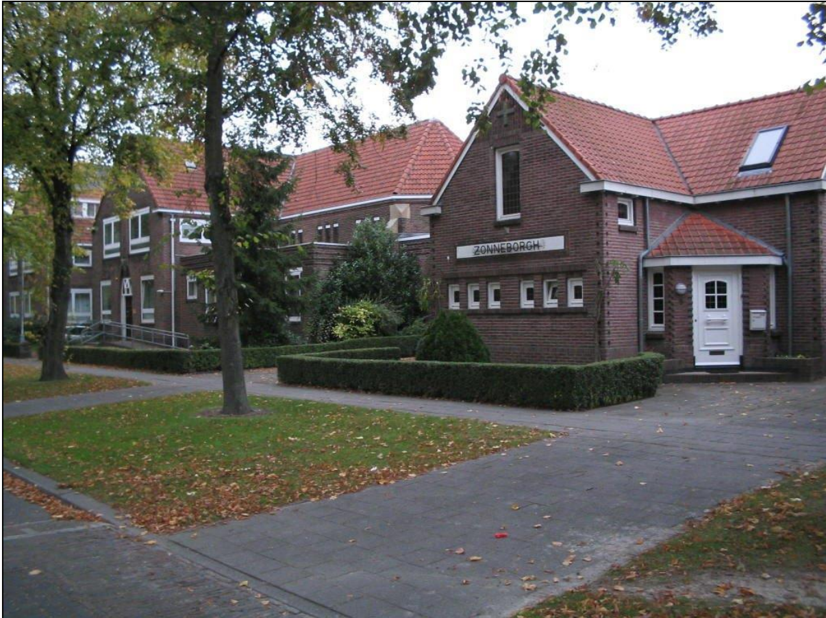
Foto: Antoniusklooster aan de Zonnestraat in Treebeek. (Foto: W. Moorer).

De verenigingsstructuur, die bij de districtorganisaties nog steeds gold, was niet ideaal voor een professioneel opererende organisatie. Het beslissingstraject was te lang omdat ledenraadpleging moest plaatsvinden.