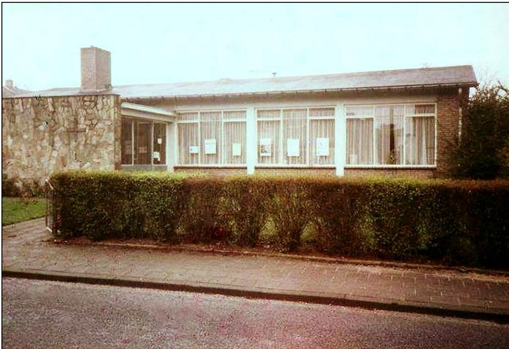
Foto: Consultatiebureau aan de Bongardstraat op de Egge. (Foto: FB Oud Brunssum).

Zij verzorgden ook de uitleen van hulpmiddelen, zoals kraam-verzorgingsmaterialen, blokken om de beddenpoten te verhogen, krukken en po-stoelen.