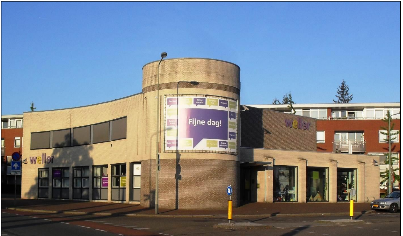
Foto: Kantoor Weller voorheen gebouw Stichting Groene Kruis OZL aan de Raadhuisstraat/Koutenveld.

De kwelling was maar van korte duur, maar de angst is nog lang blijven bestaan.