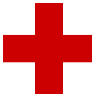
Rode Kruis vlag