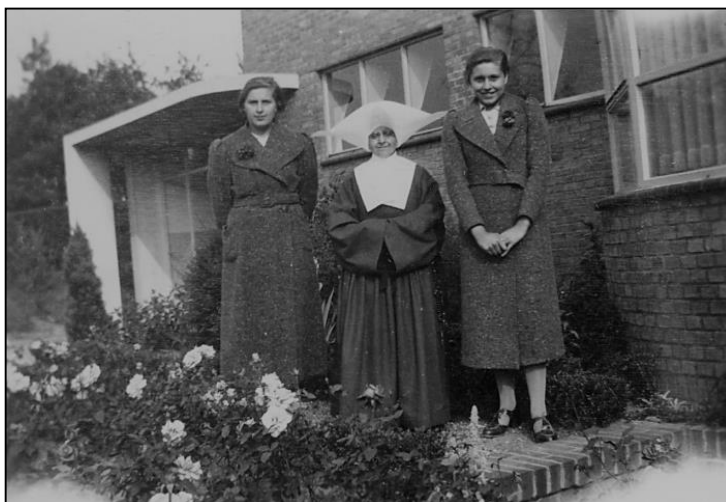
Foto: Groene Kruis aan de Prins Hendriklaan.

In datzelfde jaar verkreeg de vereniging bouwgrond aan de Prins Hendriklaan, waar in 1935 een gebouw werd gerealiseerd.